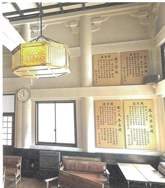
本堂芳名板イメージ