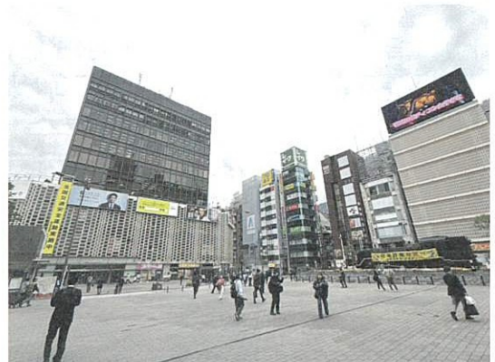
街頭インタビューで有名な新橋駅西口広場 (SL広場)

現在また再開発の計画が立てられています。ニュー新橋ビルは建物が「区分所有」で、約320人いるとされる「区分所有者」の合意が取れず、計画は難航しているようです。