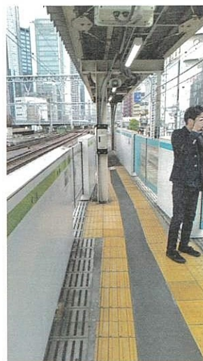
新橋駅の狭いホーム