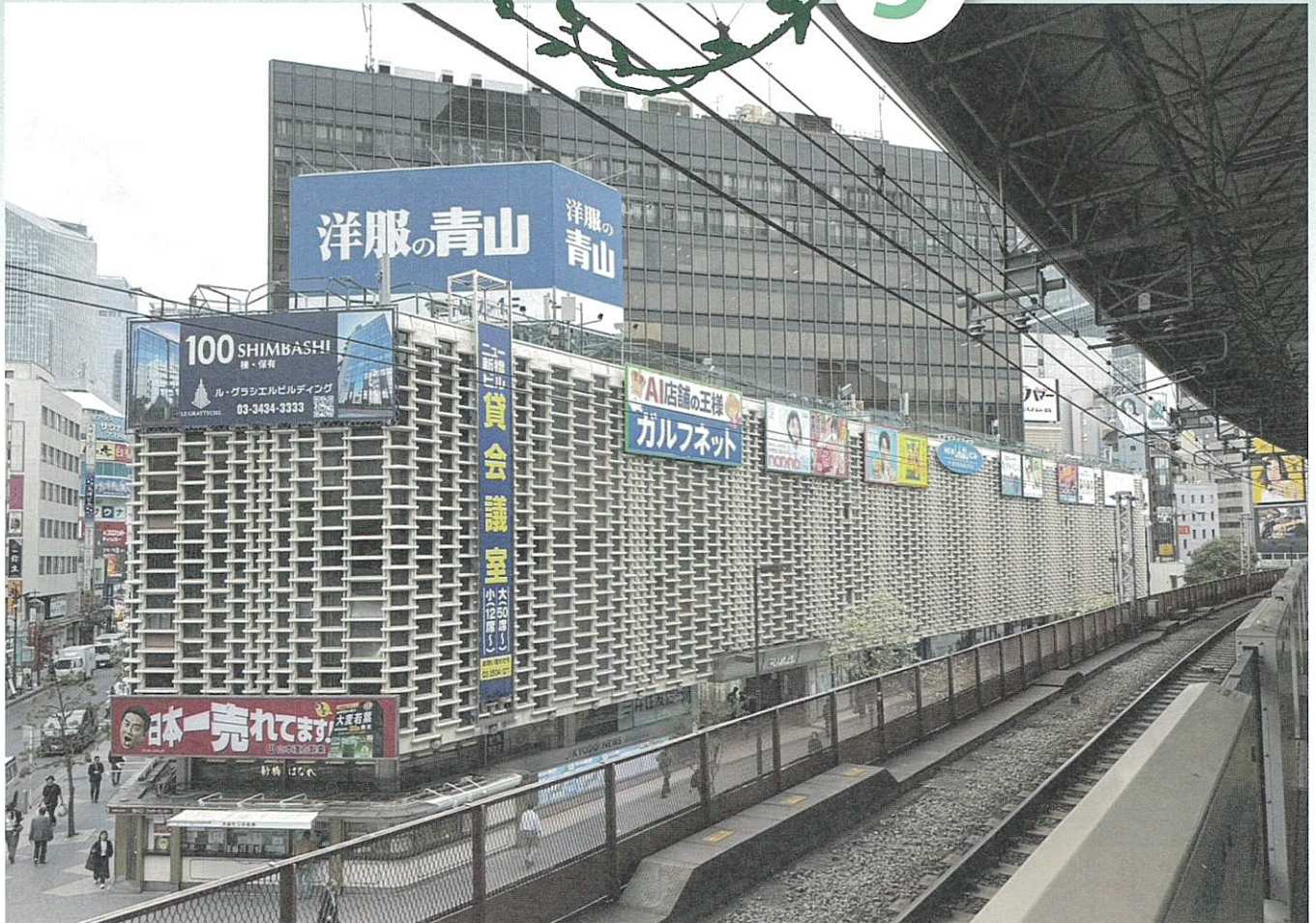
ニュー新橋ビル(港区)